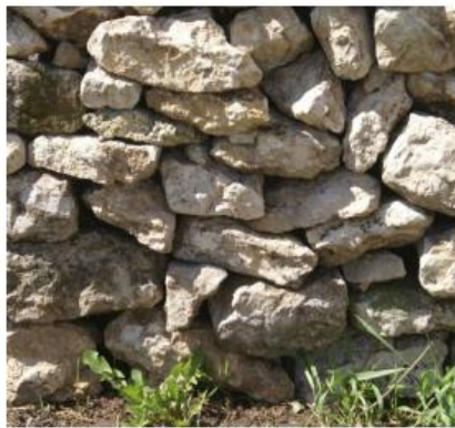
MUR EN PIERRES SECHES/ HYBERNACULUM