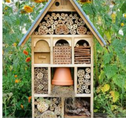
HOTEL A INSECTES