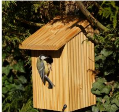
NICHOIR A OISEAUX