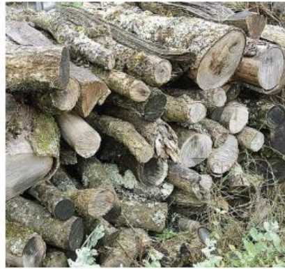
TAS DE BOIS MORTS/ HYBERNACULUM